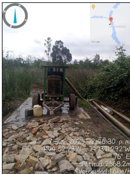
Ilustración 5. Motobomba en la ronda de Humedal

C.P. 250020 Tel. +57(1) 823 40 70 823 40 71 / 823 40 73 Fax. + 57(1) 825 76 20 Dir. Cra. 14 No. 13-05