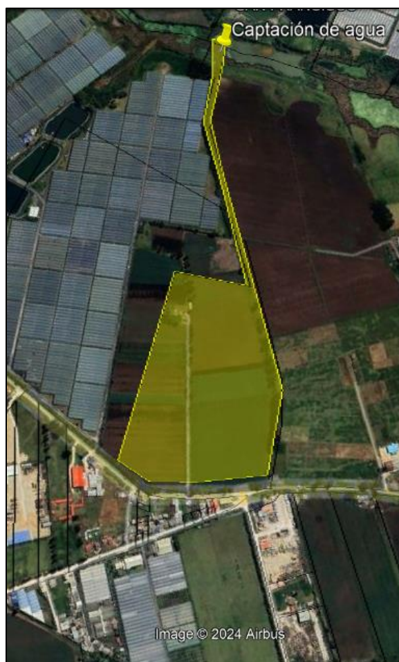
Ilustración 1. Recorrido

El día 07 de junio de 2024, se realizó recorrido de control y vigilancia en la ronda del humedal Gualí, ecosistema que fue declarado por la Corporación Autónoma Regional de Cundinamarca - CAR como Distrito Regional de Manejo Integrado a través del acuerdo 001 de 2014 "Por medio del cual se declaran como Distrito Regional de Manejo Integrado (DMI), los terrenos comprendidos por los humedales de Gualí, Tres Esquinas y Lagunas de Funzhé, y su área de influencia directa ubicada en los municipios de Funza, Mosquera y Tenjo, Cundinamarca", y estableció tres zonas: 1. Preservación (espejo de agua), 2. Recuperación (50 metros) y 3. Uso sostenible (100 metros), con el fin de identificar presuntas afectaciones ambientales. Dentro del recorrido se identificó una captación de agua superficial en el Humedal Gualí en el predio denominado "Lote 1 Finca Usatama" conocido como "La Cuña" (Ilustración 1. polígono amarillo), ubicado en la vereda El Cacique, coordenadas 4°44'52,23" N-74°13'11,292" W, como se muestra en la siguiente ilustración: