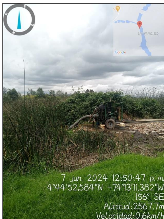
Ilustración 4. Manguera en la ronda de Humedal

En la visita técnica ambiental no fue posible confirmar si la captación contaba con los permisos ambientales otorgados por la Corporación Autónoma Regional de Cundinamarca-CAR, por lo tanto, es necesario realizar la consulta con dicha autoridad.